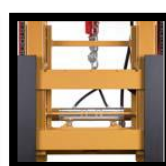
อุปกรณ์ยึดค้ำ เกียร์ด้านข้าง