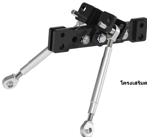
โครงเสริมความแข็งแรง