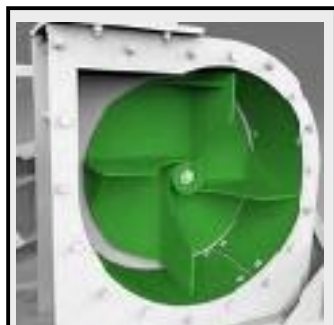
ฟันด์และด้านในฮาร์ดดอกซ์