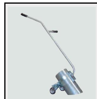
ท่อเหล็กพ่นมีล้อ.