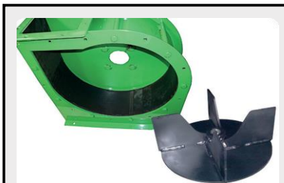
โครงและพัดลมทำจากเหล็ก ฮาร์ดดอกซ์ ความทนทานสูง