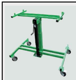
รถเข็นยกเพื่อการบรรทุกที่ ด้านข้างของรถบรรทุกได้ง่าย