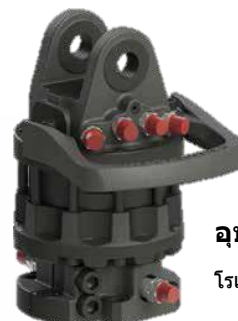
อุปกรณ์เสริม

OMEF-GROUP FORESTRY CLAMP ได้รับการพัฒนาเพื่อให้มีประสิทธิภาพที่ดีที่สุดในการเก็บเกี่ยวย้ายและตัดไม้ เพื่อรับประกันความต้านทานต่อโครงสร้างที่มากขึ้นจึงถูกนำมาใช้ของแผ่นเสริมแรงบนพื้นของกรงเล็บ คีมมีให้เลือก 6 ขนาด ทั้งสองรุ่นด้วยทูปแบบเปิดและทูปแบบปิด