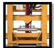
อุปกรณ์ยัดคััน เกียรด้านข้าง