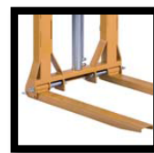
ยกปรับและ ยัดหญุนได้