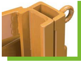
โพรไฟล์เหล็กรีดร้อน