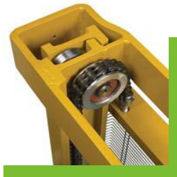
โปรไฟล์เหล็กกริดร่อน