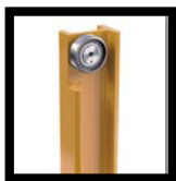
ลิฟท์ยกพร้อมลูกปืน ลูกกลิ้งทรงกระบอก เรเดียม