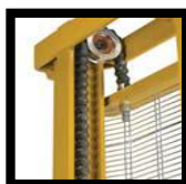
โช้ยกมาตรฐาน