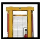
ทัศนวิสัยที่ดีเยี่ยม