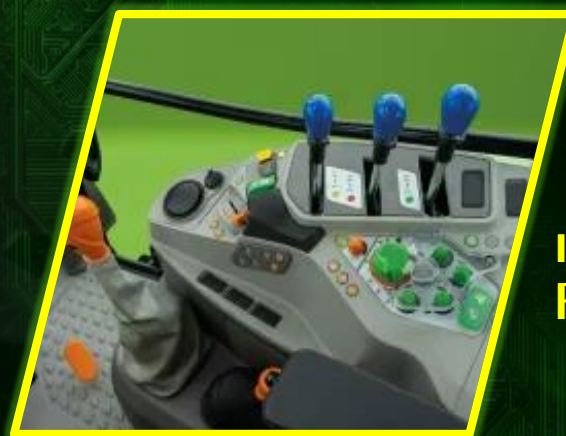
เกียร์อัตโนมัติ POWERSHIFT