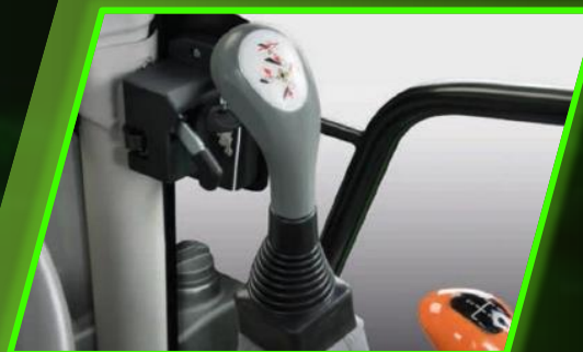
► ง่ายสติกโกลดด้านหน้าแบบครบวงจร