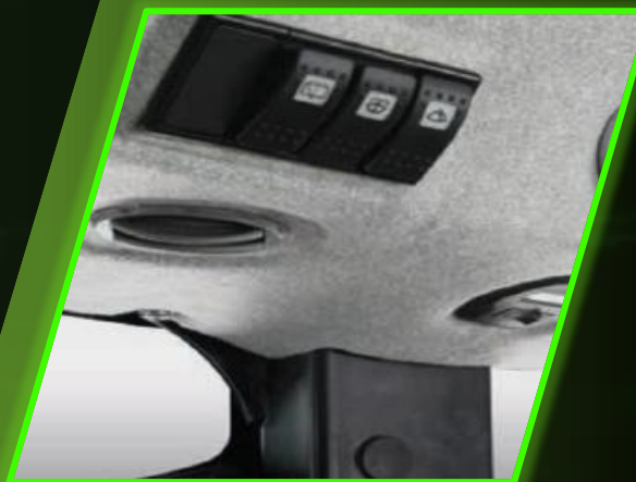
► ความสะดวกสบายด้วยเครื่องปรับอากาศเสริม