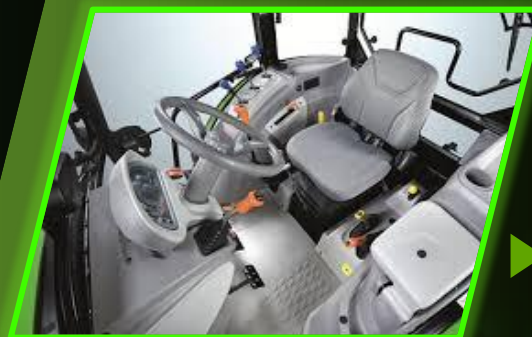
► ห้องสารกว้างขวาง