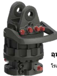
อุปกรณ์เสริม โรเตอร์การหมุน 360°

OMEF-GROUP FORESTRY CLAMP ได้รับการพัฒนาเพื่อให้มีประสิทธิภาพที่ดีที่สุดในการเก็บเกี่ยวย้ายและตัดไม้ เพื่อรับประกันความต้านทานต่อโครงสร้างที่มากขึ้นจึงถูกนำมาใช้ของแผ่นเสริมแรงบนพื้นของกรงเล็บ คีมมีให้เลือก 6 ขนาด ทั้งสองรุ่นด้วยทูปแบบเปิดและทูปแบบปิด